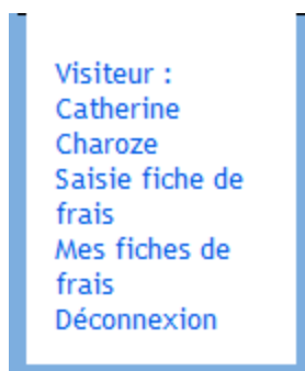
Sommaire de l'application pour les visiteurs

Pour être redirigé vers une autre page, il faut la sélectionner dans le sommaire.