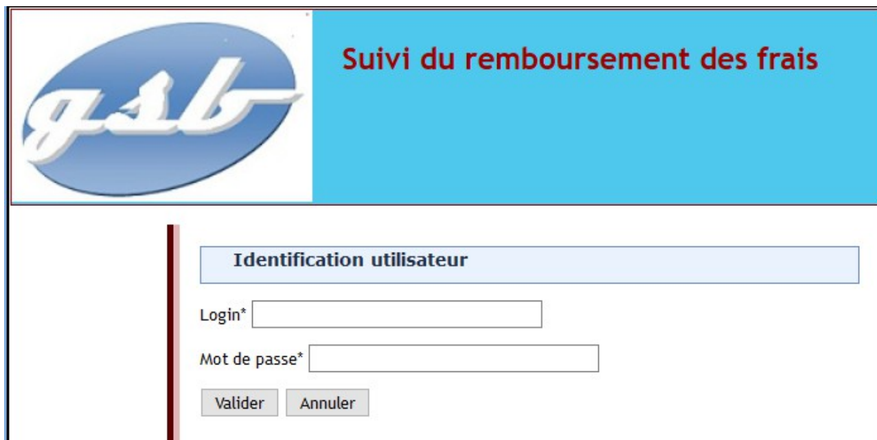
Interface de connexion

Lors du lancement de l'application web, vous allez être dirigés sur une page d'authentification. Saisissez alors votre identifiant et votre mot de passe.